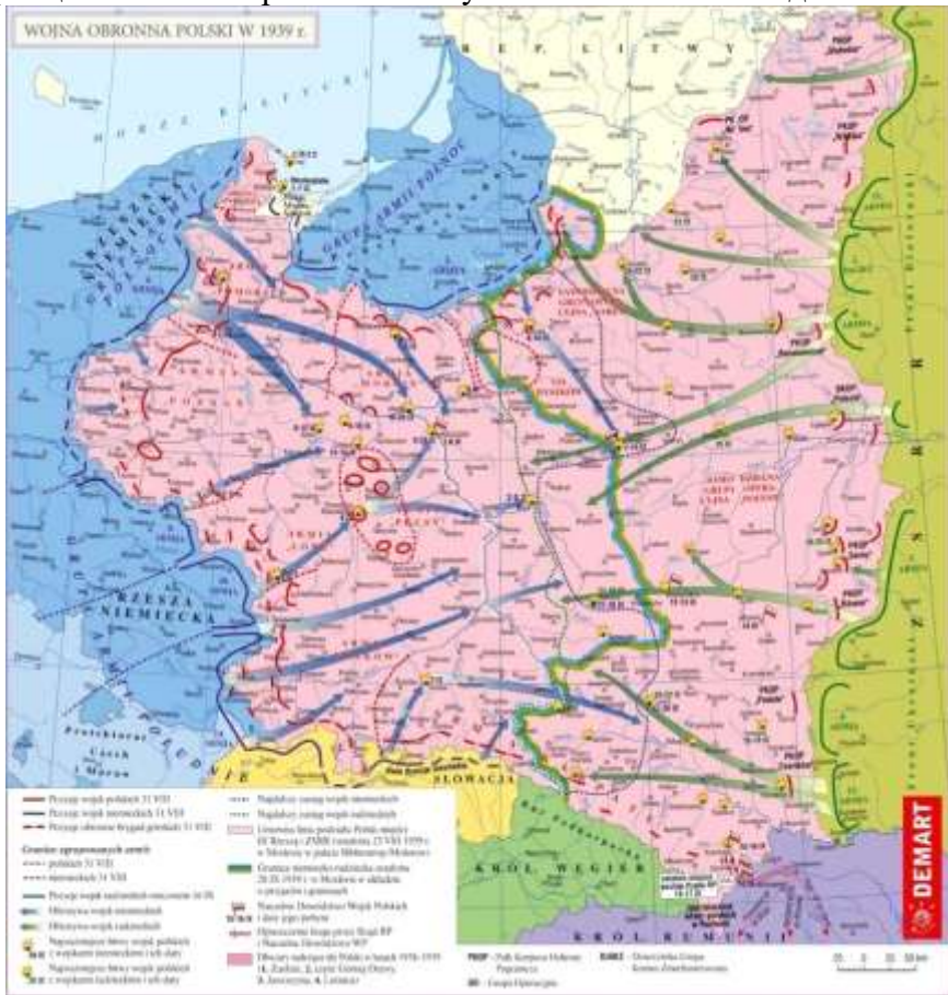
Рис. 2. 1939 г., войскам РККА был разослан

Из опубликованных ныне документов видно, что Советский Союз не вмешивался в происходящее до тех пор, пока сохранялись хотя бы малейшие шансы на то, что Польша сумеет продолжить борьбу, либо на то, что Франция и Великобритания начнут полномасштабные действия против Германии.