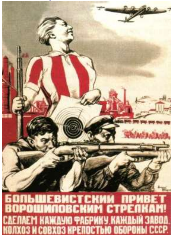
Рис. 7. Советский плакат. Художник Василий Ёлкин.